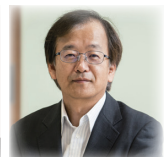
(株)インプレス 編集委員 IT Leaders プロデューサー