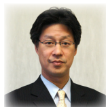
(株)NTTデータ経営研究所 エグゼクティブ・オフィサー