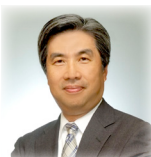
三菱ケミカル(株) リコーITソリューションズ(株) 情報システム部長 代表取締役 社長執行役員